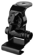
AP1733 SOPORTE P/ MALETERO BI-ARTICULADO NEGRO