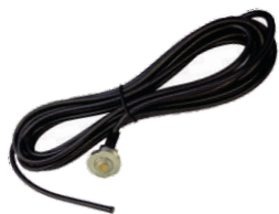
Cabo coaxial RG58 95%