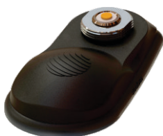
Base NMO integrada